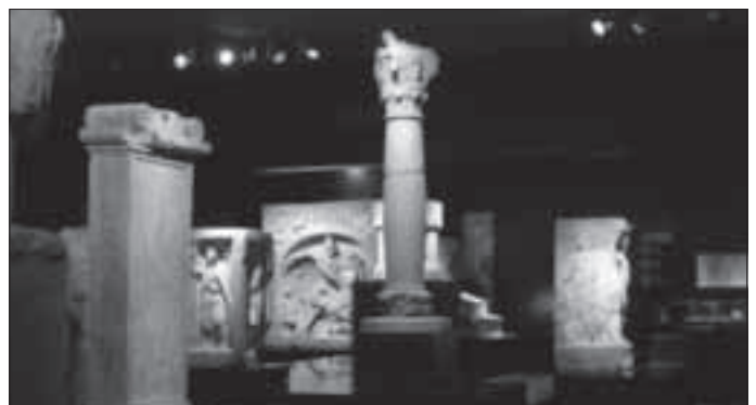
Römermuseum Osterburken

Um 160 n. Chr. wurde die Grenze in Obergermanien und Rätien vorgeschoben, d.h. im Odenwald folgte auf den Odenwaldlimes schon nach einem halben Jahrhundert der ca. 30 km nach Osten verlegte Obergermanisch-Rätische Limes . Dieser verlief von Miltenberg am Main über Osterburken 80 km schnurgerade bis zum Limesknick bei Lorch, von hier über Aalen nach Osten zur Donau. Die Kastelle im Odenwald wurden aufgegeben und die Einheiten von dort an die Kastelle der neuen Limeslinie verlegt, so die Besatzungen von Neckarburken nach Osterburken. Gründe für die Verschiebung des Limes könnten Grenzbegradigung aber auch zunehmende Machtdemonstration Roms gegen die Germanen gewesen sein. Aber um 260 n. Chr. wendet sich das Blatt: Die zunehmenden Überfälle germanischer Stämme, vor allem der Alemannen, zwang die Römer zur Aufgabe des Limes und damit auch des Kastells Osterburken. Die Reichsgrenze wurde an den Rhein zurück verlegt. So werden die Kastelle Neckarburken und Osterburken zu Zeugen der größten Ausdehnung und des Kollapses der Römischen Reichs in unserer Region.